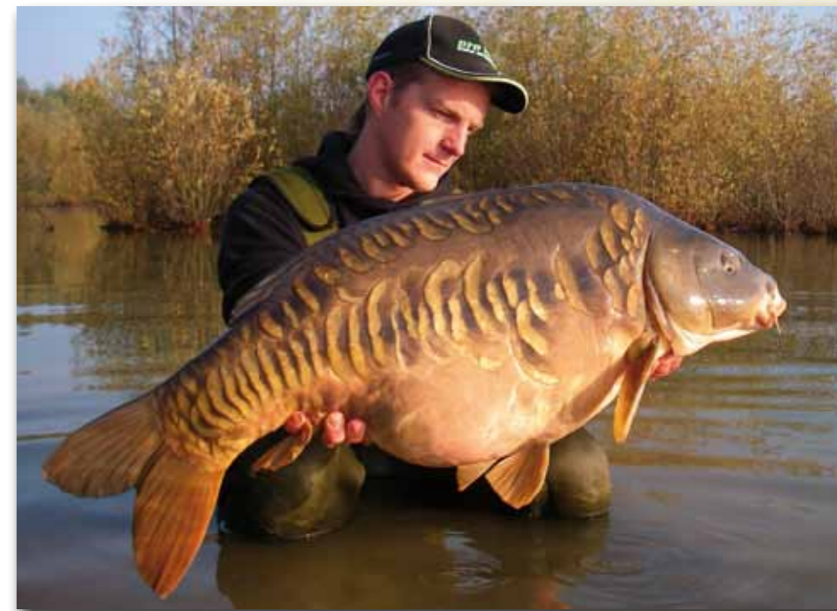
Vom Fang eines solchen Fisches kann man lange zehren