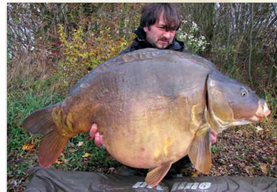
Unter den gefangenen Fischen war sogar ein Fünfinger!

Tatsächlich ging unsere Rechnung auf. Es dauerte nicht lange, da fingen wir mit unserer neuen Methode am Lac La Traque die ersten Fische. Auch am Great Lake schienen die neuen Sticks ein echter Renner zu sein. Denn