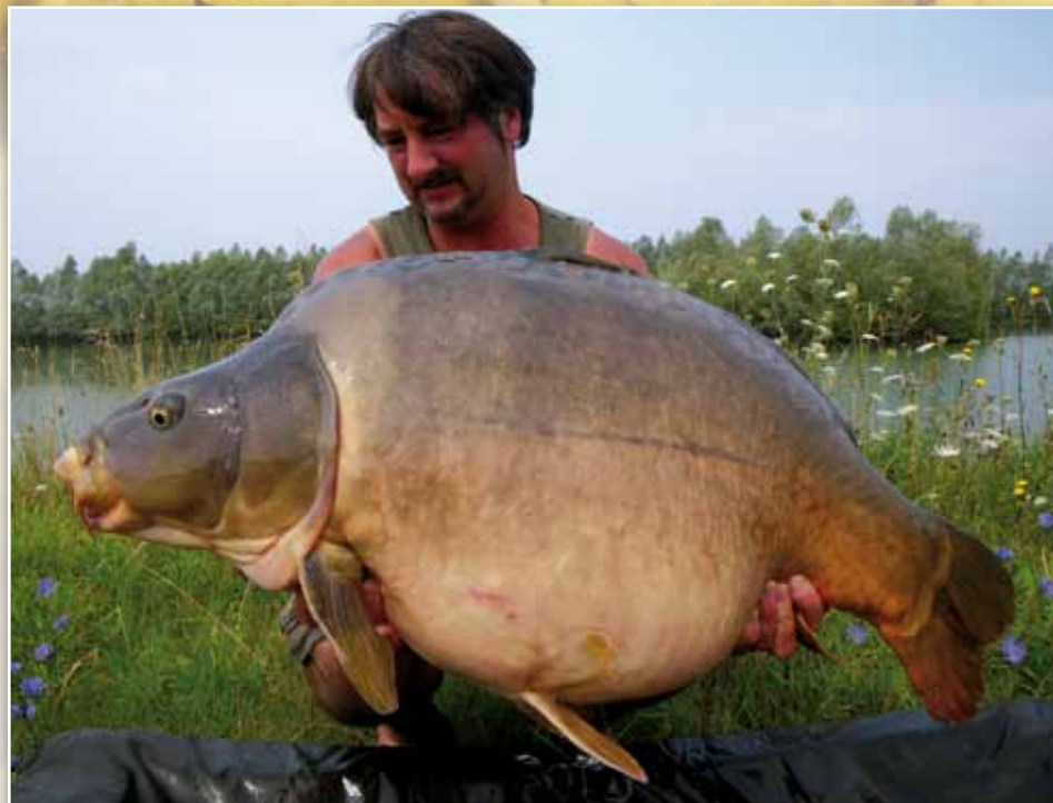
Dick und schwer - ein kapitaler Spiegler aus dem Great Lake

Pro Line in der Größe 6, dazu über dem Ohr ein hartes Stück Tube, um einen Line-Aligner-Effekt zu erzielen.