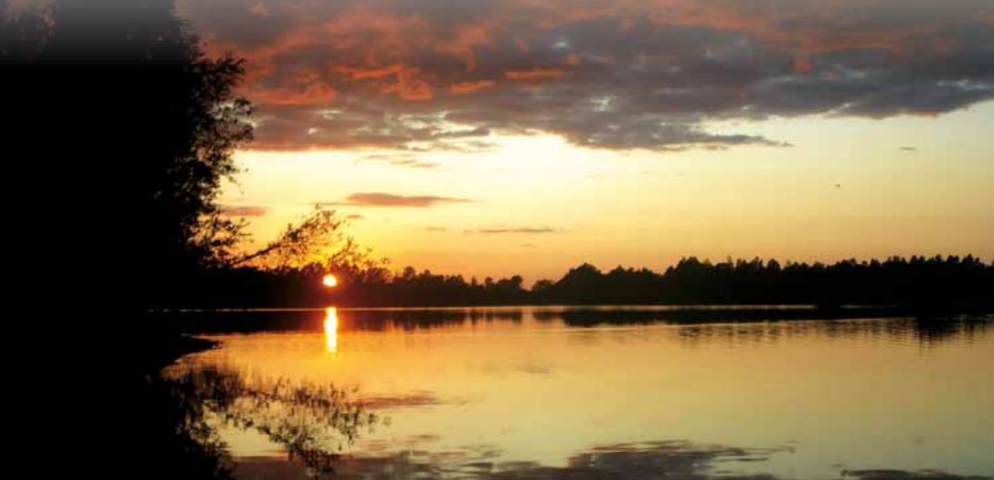
Der 27 Hektar große Baggersee liegt nicht weit vom bekannten Lac du Der entfernt