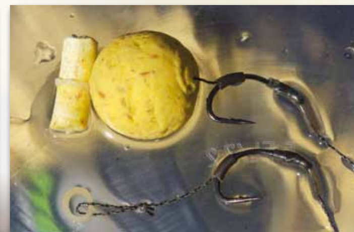
Genial einfach: Der Stick wird mit einem Baitband befestigt