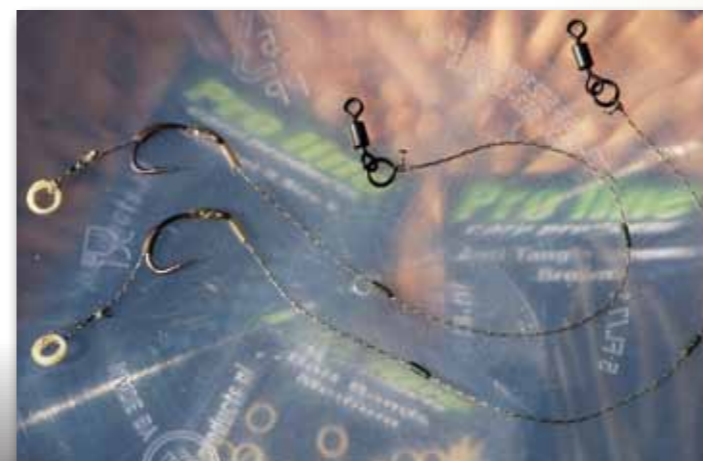
Eddy's Stick-Rig basiert auf einer einfachen Standard-Montage

Für mein Stick-Rig verwende ich eine einfache Montage, die ich in neun von zehn Fällen auch sonst verwende – selbst an schwierigen Gewässern. Meine Montage besteht aus einer möglichst weichen Vorfachschnur, ungefähr zwölf Zentimeter lang. Als Haken verwende ich seit etwa fünf Jahren den Concept 5 von