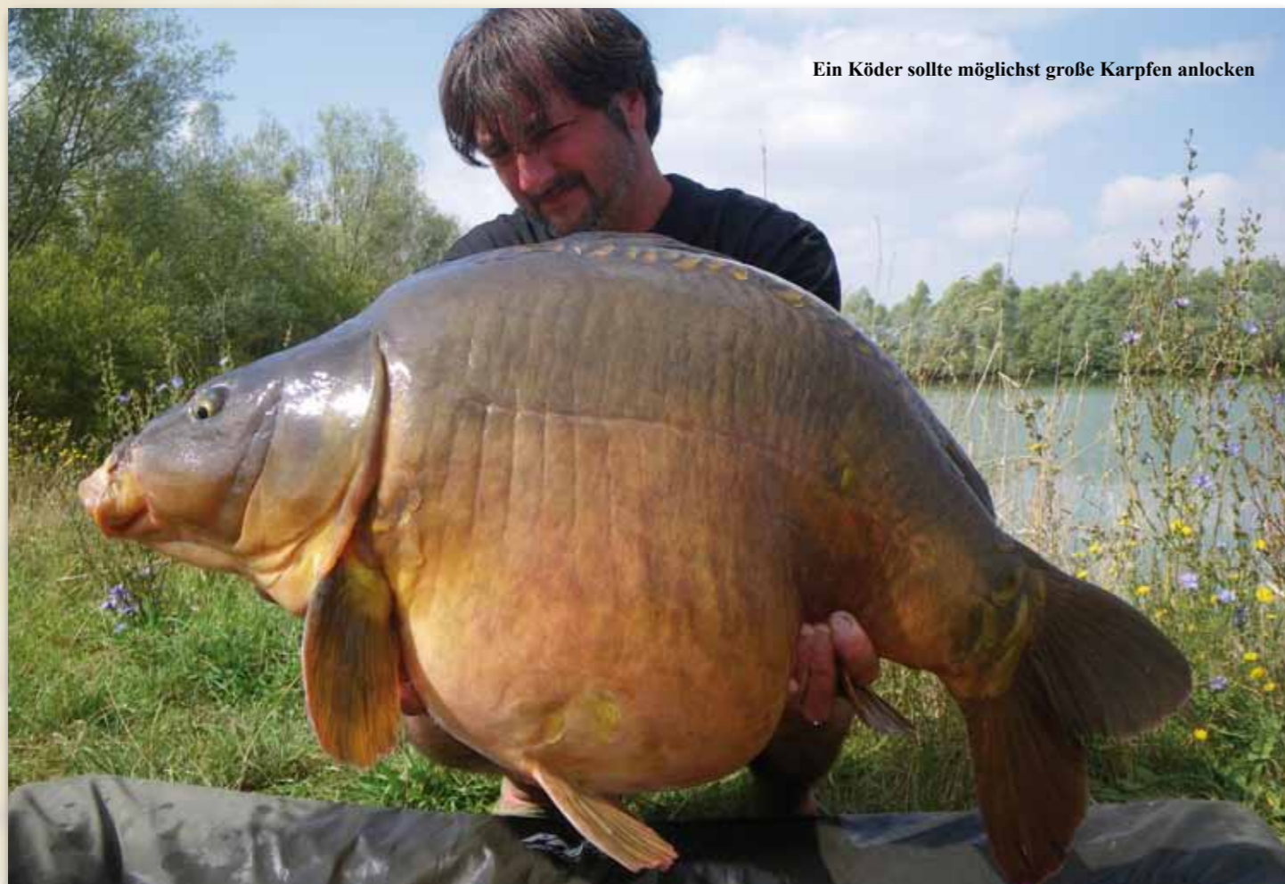
Ein Köder sollte möglichst große Karpfen anlocken

gen eines Zeilenkarpfens, der so schön und makellos ist, dass mir bereits sein Foto die Freuden-Tränen in die Augen treibt. Um diesen Fisch zu fangen, hatte ich einen neuen Köder im Gepäck: Die Sticks von Pro Line. Diese wollte ich einem gründlichen Praxis-Test unterziehen.