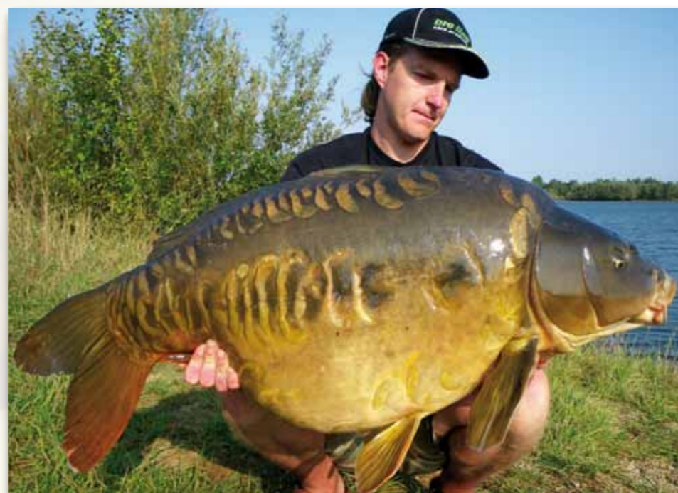
Der Great Lake ist für seine besonders schönen Karpfen bekannt

Die Pro Line Sticks bezeichne ich allerdings nicht als Pellets. Zwar werden diese Sticks in eine längliche, pelletartige Form gepresst. Doch damit hören die Gemeinsamkeiten schon auf. Denn diese Sticks basieren auf der